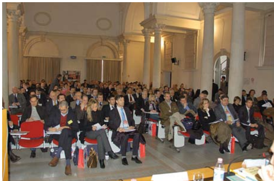
Un momento dei lavori nella tappa di Vicenza.

Per maggiori informazioni e per consultare il materiale utilizzato negli incontri, potete visitare il sito internet di Assicura www.edipi.com